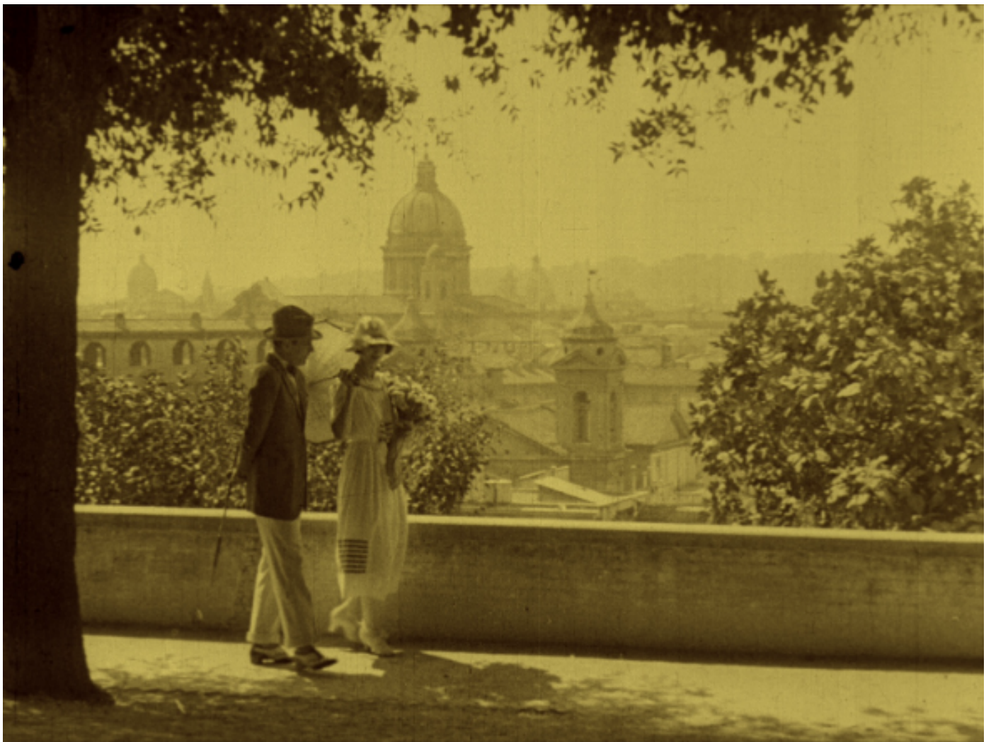
Il volto di Medusa (Alfredo De Antoni, Do.re.mi., Roma, 1920) CSC – Cineteca Nazionale

Amore senza stima (Baldassarre Negrone, Celio Film, Roma, 1912) – CSC Cineteca Nazionale Usuraio e padre (Guido Brignone, Film d'Arte Italiana, Roma, 1914) Quo vadis? (Enrico Guazzoni, Cines, Roma, 1913) - CSC Cineteca Nazionale Caccia ai milioni (Cines, Roma, 1914) Thaïs (Anton Giulio Bragaglia, Riccardo Cassano, Novissima Film, Roma 1916) - CSC Cineteca Nazionale Il Processo Clémenceau (Caesar Film, Roma, 1917) Fabiola (Palatino Film, Roma, 1918) – CSC Cineteca Nazionale Tosca (Alfredo De Antoni, Caesar Film, Roma, 1918) Il volto di Medusa (Alfredo De Antoni, Do.re.mi., Roma, 1920) – CSC Cineteca Nazionale Il fauno di marmo (Mario Bonnard, Celio Film, UCI, Roma, 1920) – CSC Cineteca Nazionale La Mirabile visione (Caramba, Tespi Film, Roma, 1921) Fantasia 'e surdate (Elvira Notari, Dora Film, Napoli, 1927) – CSC Cineteca Nazionale La Contessa Sara (Roberto Roberti, Bertini Films/Caesar Films, 1919)