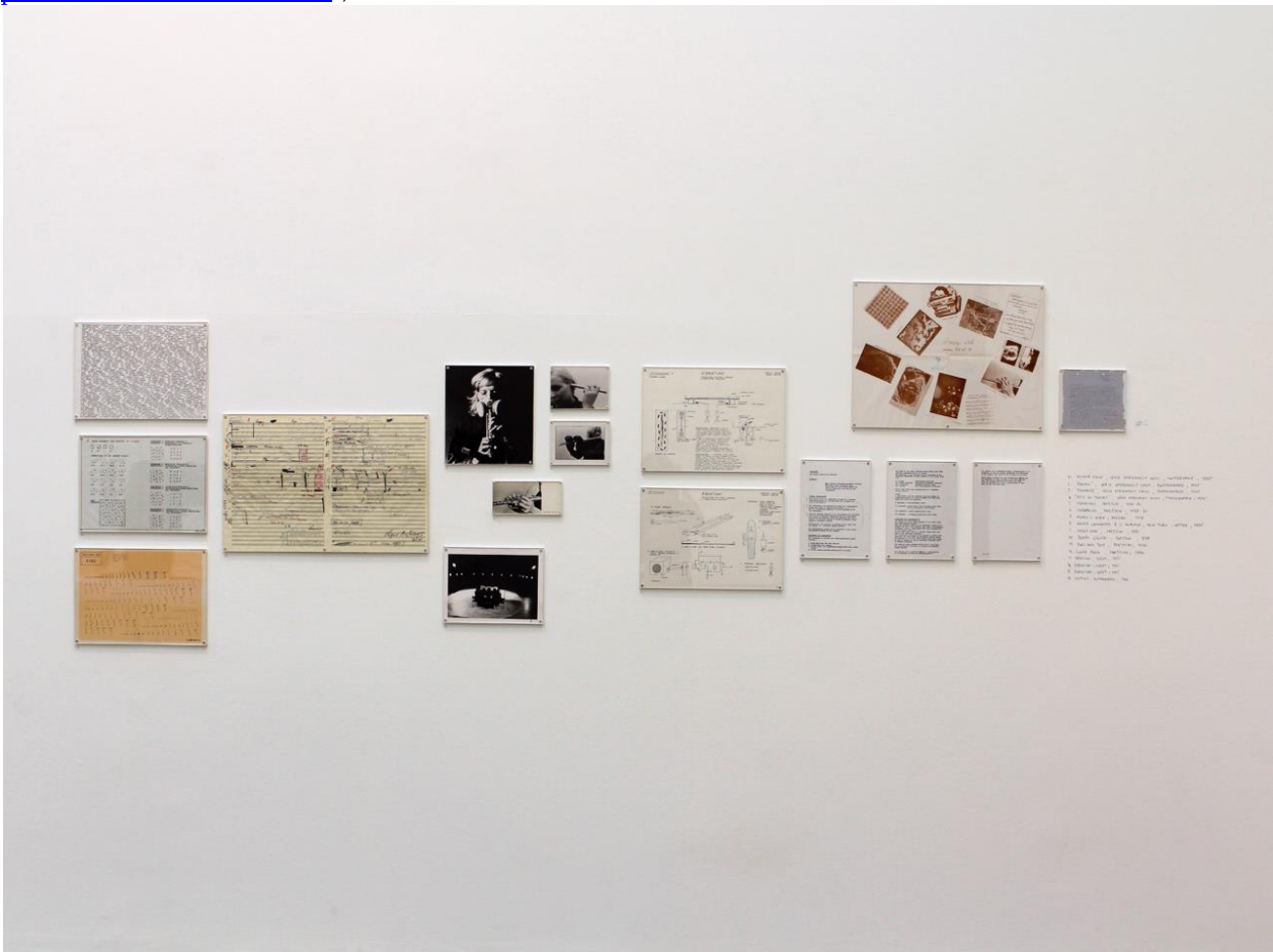
Échos magnétiques. Christina Kubisch, Musée des Beaux-Arts de Rennes, avril 2019 (vue d'exposition).

L'exposition (première en France de l'artiste) fait suite à la découverte des archives de Christina Kubisch dans les archives de la Biennale de Paris dans les fonds des collections de l'INHA – Archives de la critique d'art, de la Bibliothèque Kandinsky et de l'Institut National de l'Audiovisuel grâce au programme de recherche « 1959-1985, au prisme de la Biennale de Paris », de l'Institut National d'Histoire de l'Art.